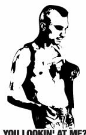
YOU LOOKIN' AT ME?